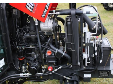
Ympäristöystävällinen moottori, hiljainen ja polttoainetaloudellinen

Hydrostaattisessa vaihteistossa on vakionopeuden säädin ja kolme aluetta, suunta on helppo vaihtaa polkimilla.