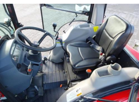
Helpot hallintalaitteet ja mukava istuin kuljettajalle