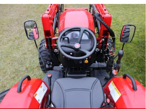
Helpot hallintalaitteet ja mukava istuin kuljettajalle